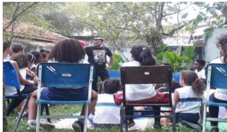
PAQUETÁ CORRIDA VIP

Apresentando como dinâmica, além da leitura de poemas de autores consagrados como Carlos Drummond de Andrade e Mario Quintana, e de poemas próprios, uma lúdica recreativa com as crianças, fazendo uso de desenhos e recortes de palavras, despertando a interatividade, de modo a convidá-los a entrar em diversas ruas da ficção, compostas por vizinhos, casas, veículos, árvores, brinquedos e animais domésticos. Jovens Fotógrafos fizeram a cobertura fotográfica do evento.