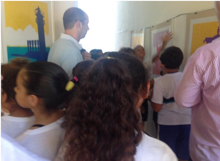
Aproposta da oficina