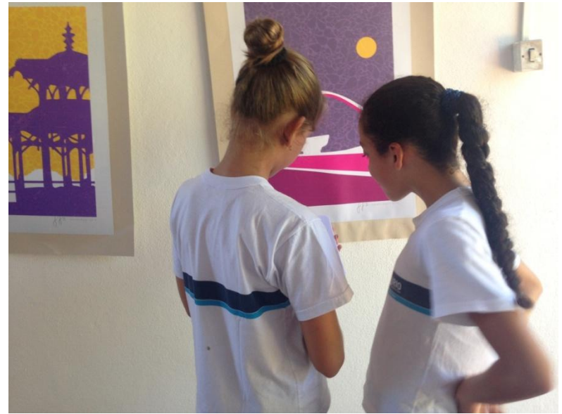
Trabalhando no desenho