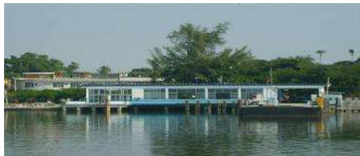
Estação Paquetá